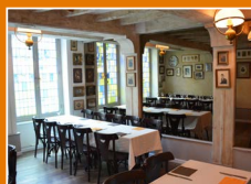
PORTRAITS DE FAMILLE

Nos salons sont adaptables et peuvent accueillir jusqu'à 18, 33 et 64 personnes, en format assis, conférence ou cocktail, grandes ou petites tables et salle en U.